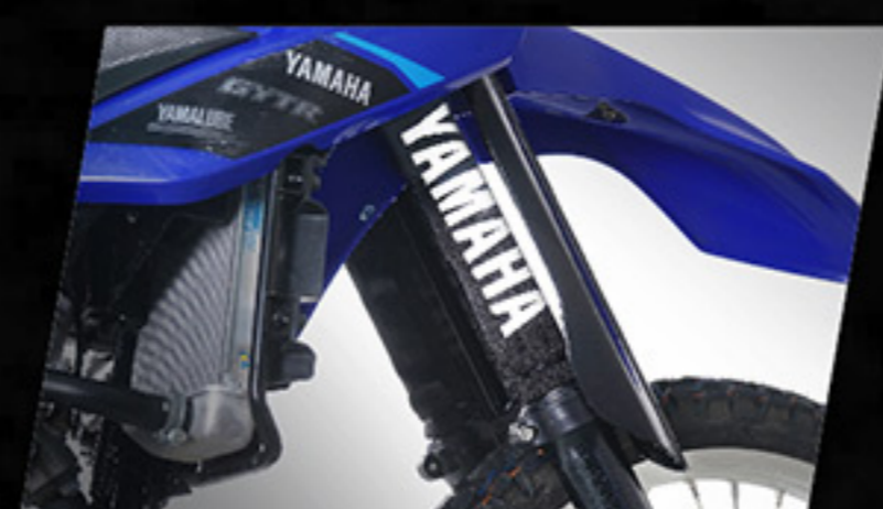
ชุดครอบโช้คหน้า