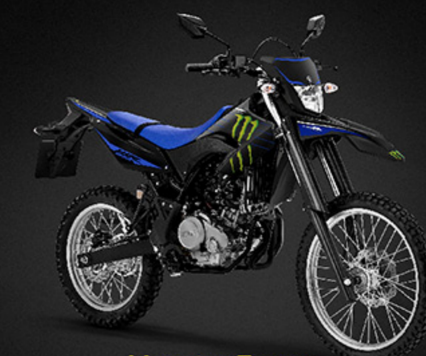
Monster Energy Yamaha MotoGP B3M8