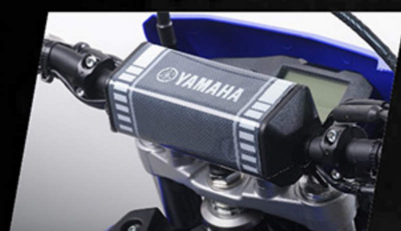
นมวแฮนด์