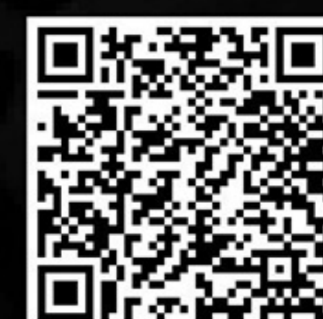
สแกน QR Code เพื่อดูอะไหล่ทดแทนที่ติดตั้ง