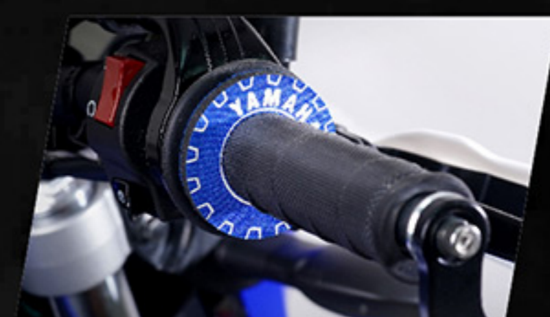
แผ่นรองปลอกแฮนด์