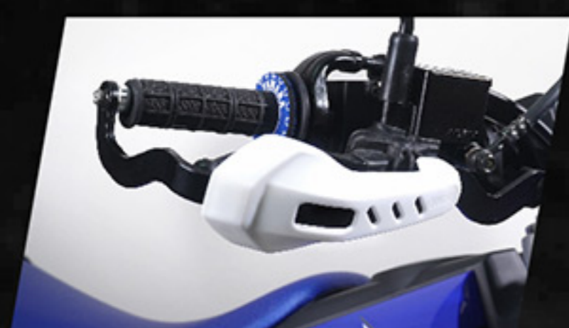
ชุดการ์ดแฮนด์