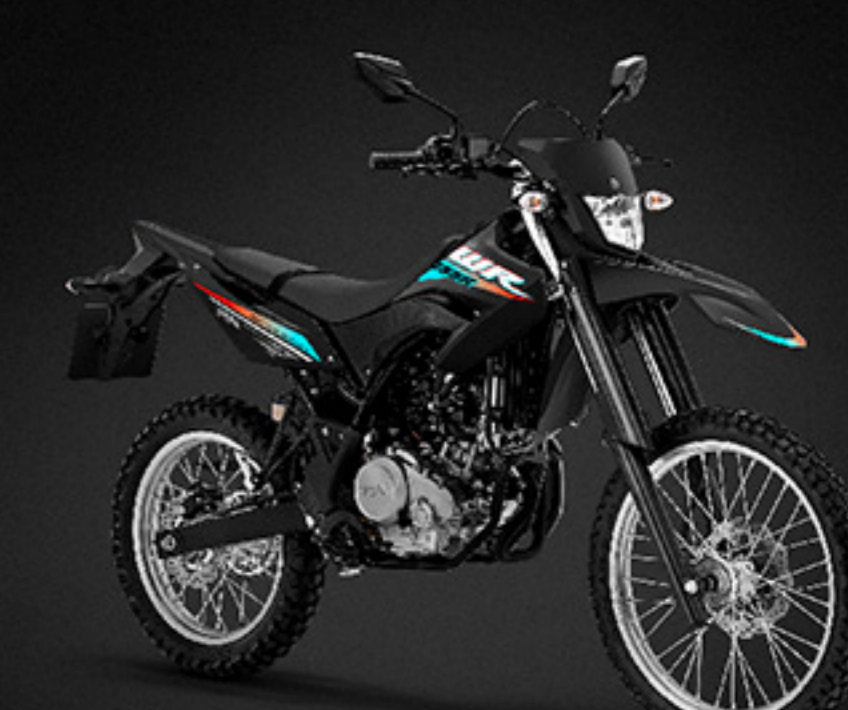
Yamaha Black B3M5-B

**บริษัทฯ ขอสงวนสิทธิ์การเปลี่ยนแปลงข้อมูลโดยไม่ต้องแจ้งให้ทราบล่วงหน้า