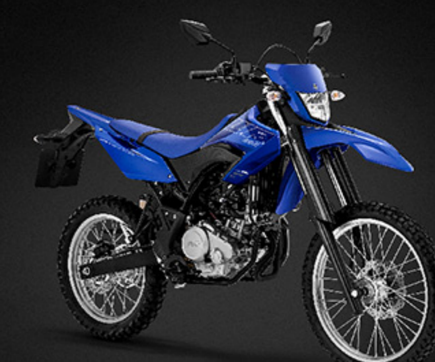
Yamaha Blue B3M5-A