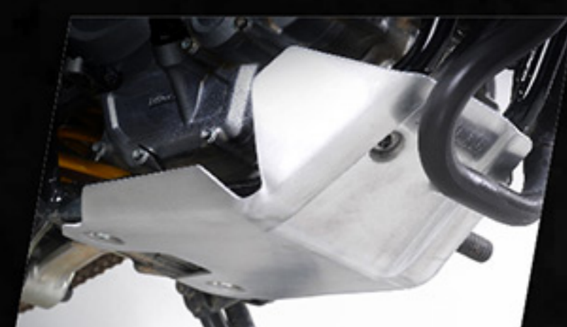
ชุดฝาครอบแก๊สคันล่าง