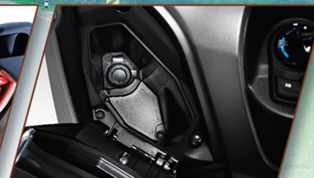
ช่องชาร์จแบตเตอรี่หรืออุปกรณ์นำทาง ขนาด 12V พร้อมช่องเก็บของด้านหน้า