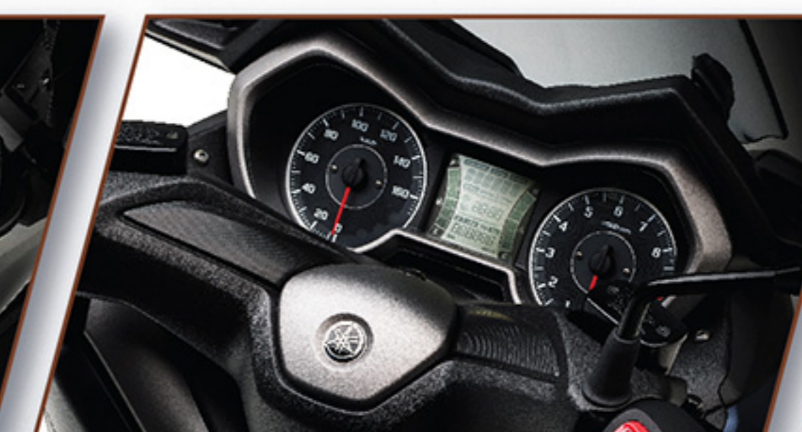
MULTI-FUNCTION DIGITAL METER จอ LCD สีสันสปอร์ต ครบทุกฟังก์ชัน พร้อมสวิตช์เปลี่ยนโหมดที่แฮนด์