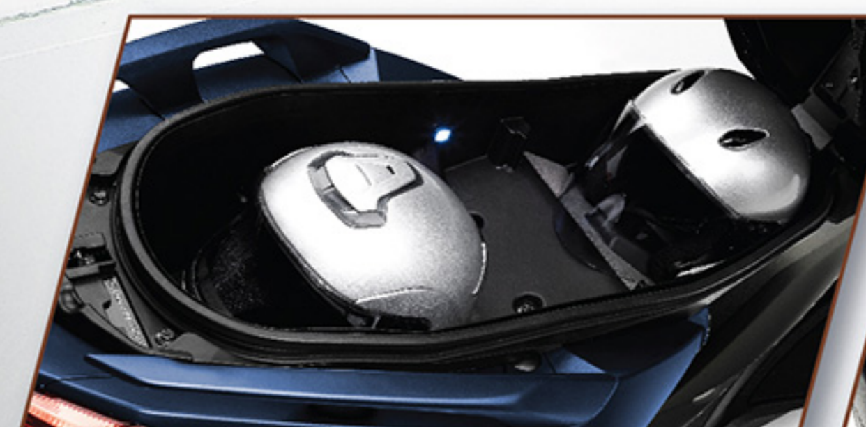
ถังน้ำมันขนาด 13 ลิตร พร้อมที่เก็บของใต้เบาะขนาดใหญ่ จุน้ำมันได้มาก หมดกังวลทุกการเดินทางไกล และเก็บหมวกกันน็อกเต็มใบได้ถึง 2 ใบ