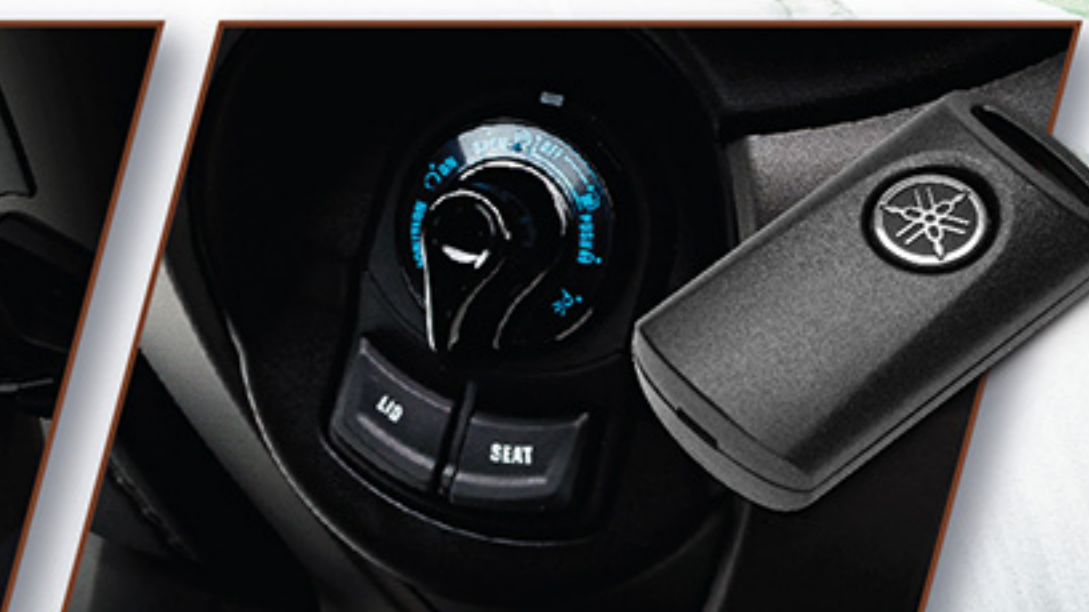
กุญแจรีโมทอัจฉริยะ: SMART KEY SYSTEM • สตาร์ทหรือดับเครื่องยนต์ • สัญญาณตอบรับ ANSWER BACK • ปลดล็อกแฮนด์รถ / ปลดล็อกเบาะ / ปลดล็อกฝาปิดถังน้ำมัน