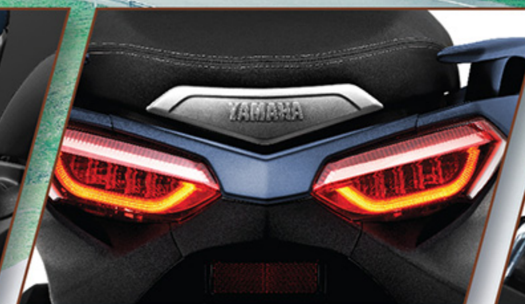
ไฟหน้า-ไฟท้าย FULL LED ดีไซน์สปอร์ตเรียบคม ดูดี สไตล์ MAX Series สว่างชัดเจน เพิ่มวิสัยทัศน์ในการขับขี่