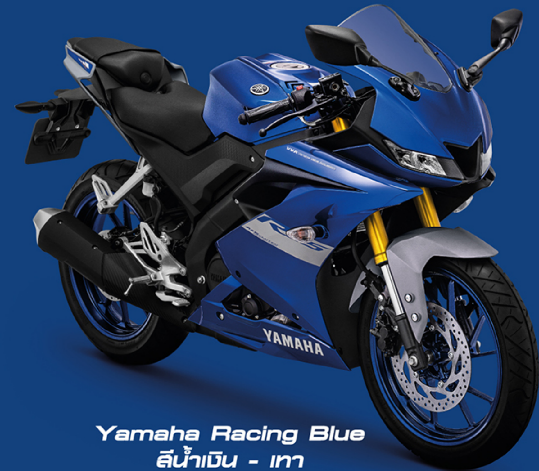
Yamaha Racing Blue สีน้ำเงิน - เทา

หมายเหตุ: การติดตั้งท่อไอเสียต้องอยู่ภายใต้ข้อกำหนดทางกฎหมาย ผู้ใช้งานหรือเจ้าของรถควรศึกษาข้อกำหนดฯ เงื่อนไขการรับประกันความจำเป็นที่อาจต้องขอรับการเปลี่ยนแปลงต่อเติม และคู่มืออย่างละเอียดก่อนการติดตั้ง