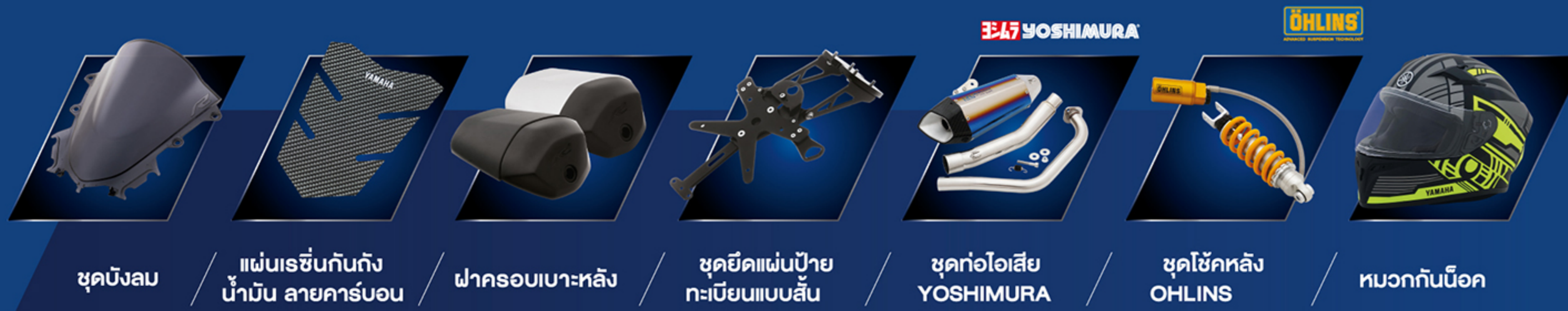
ชุดบังลม