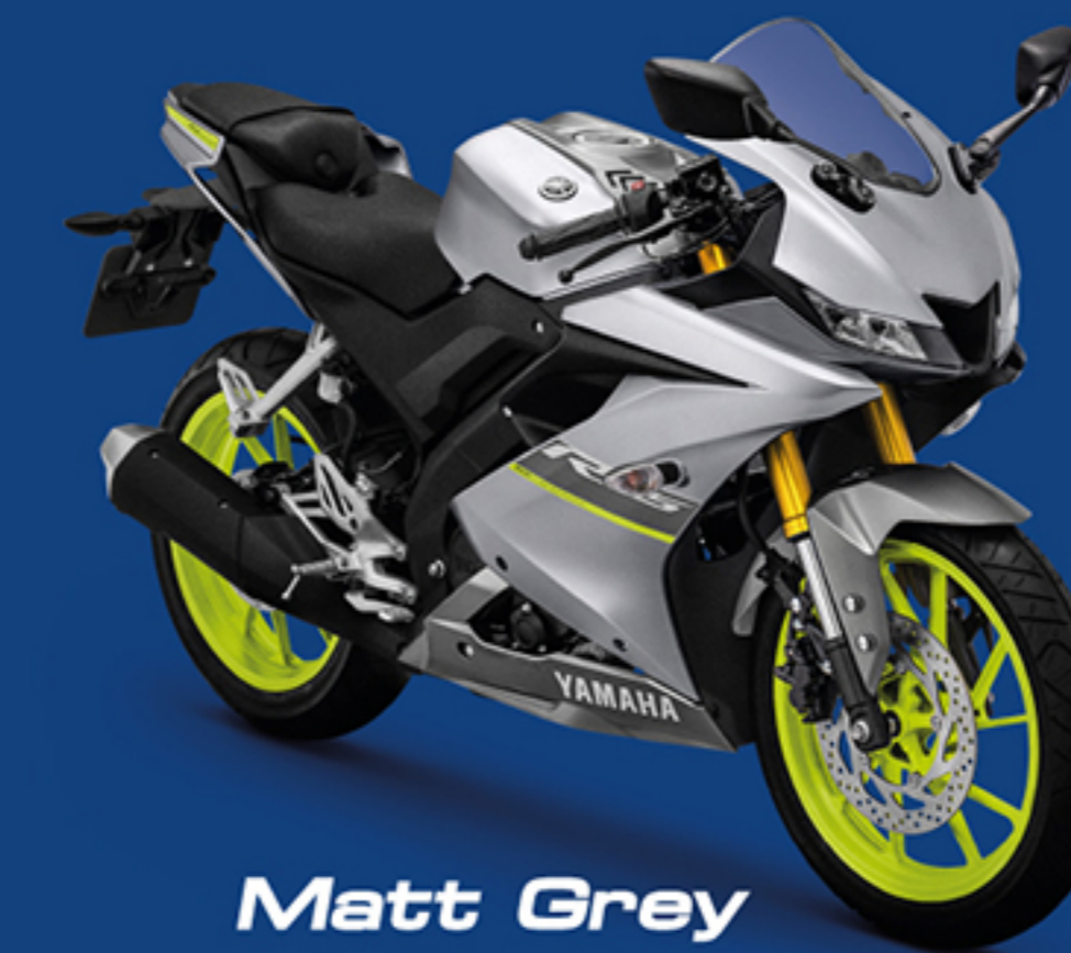
Matt Grey สีเทา

ไฟหน้า แบตเตอรี่ LED 12 V. 3.0 Ah/GTZ4V (MF)