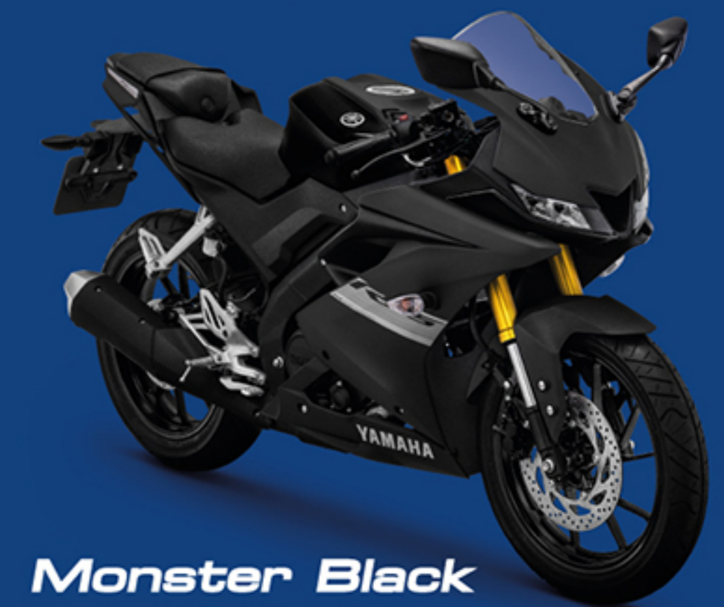
Monster Black สีดำ