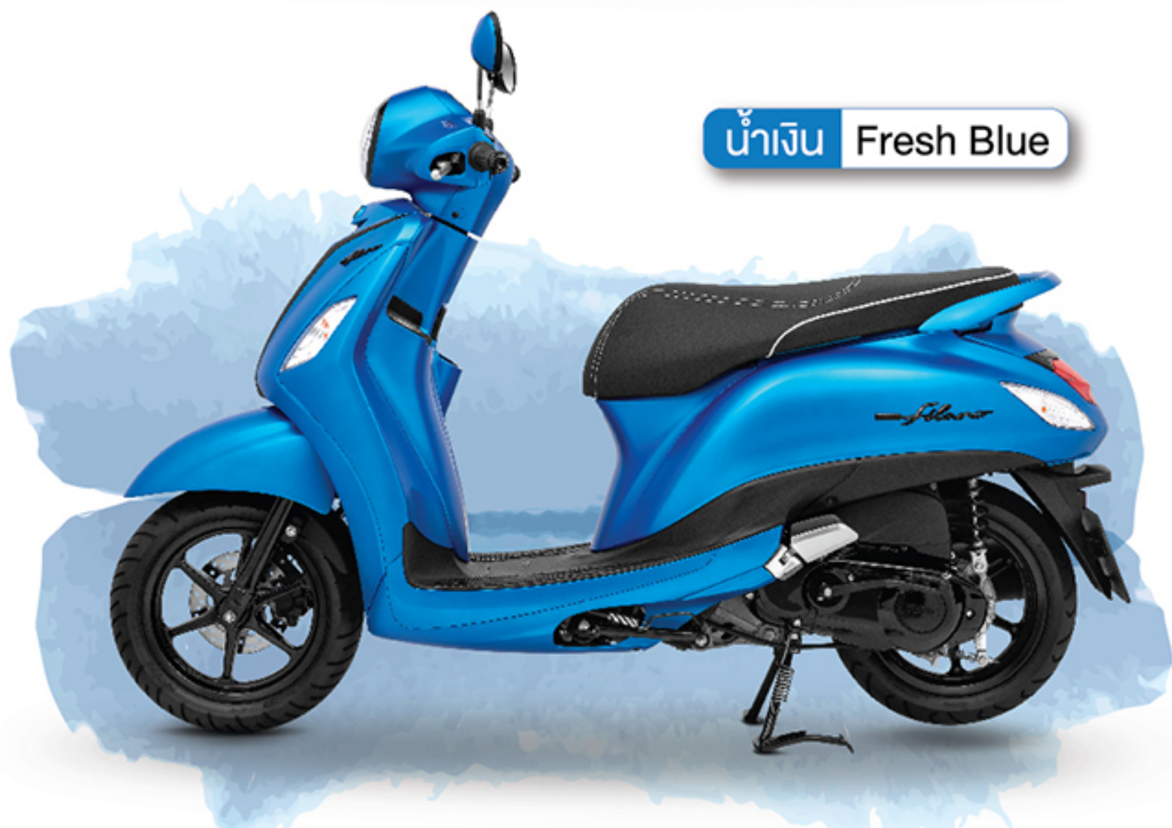
น้ำเงิน Fresh Blue