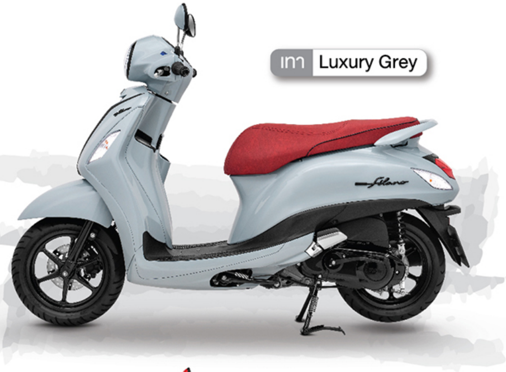
เทา Luxury Grey