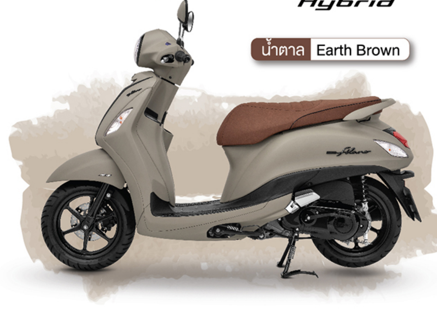
น้ำตาล Earth Brown