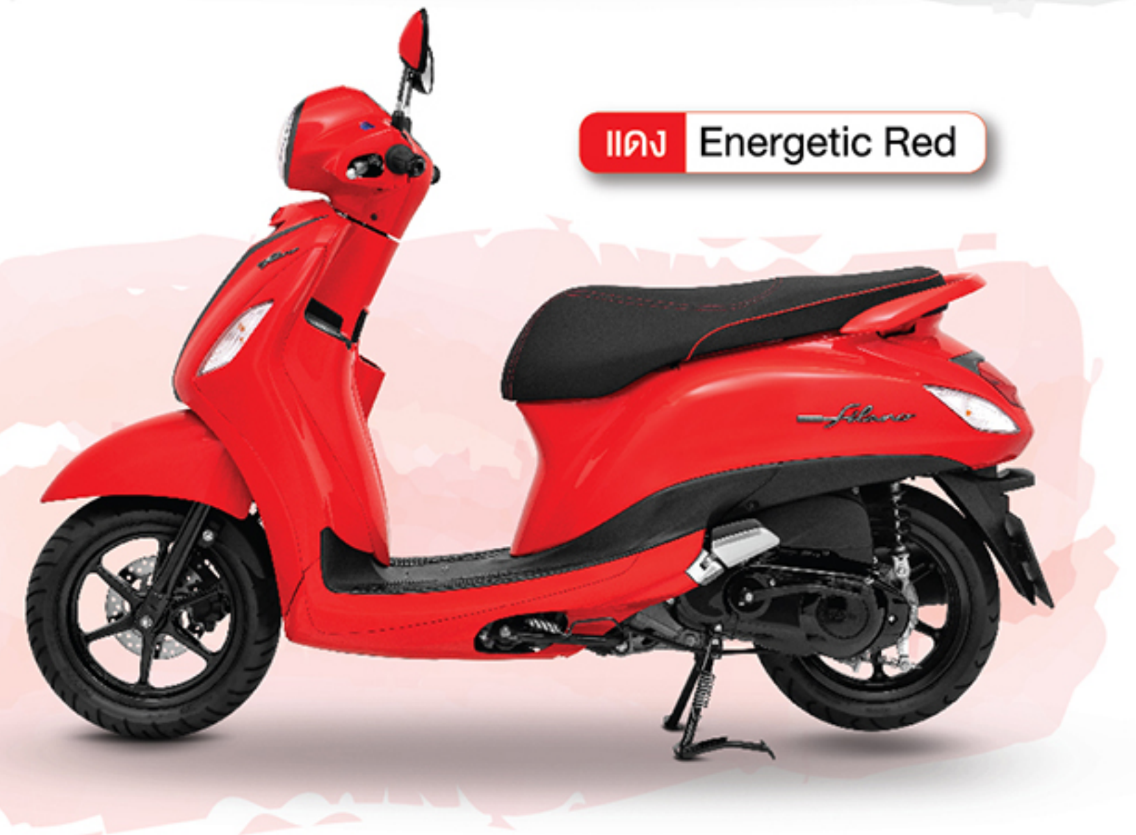
แดง Energetic Red