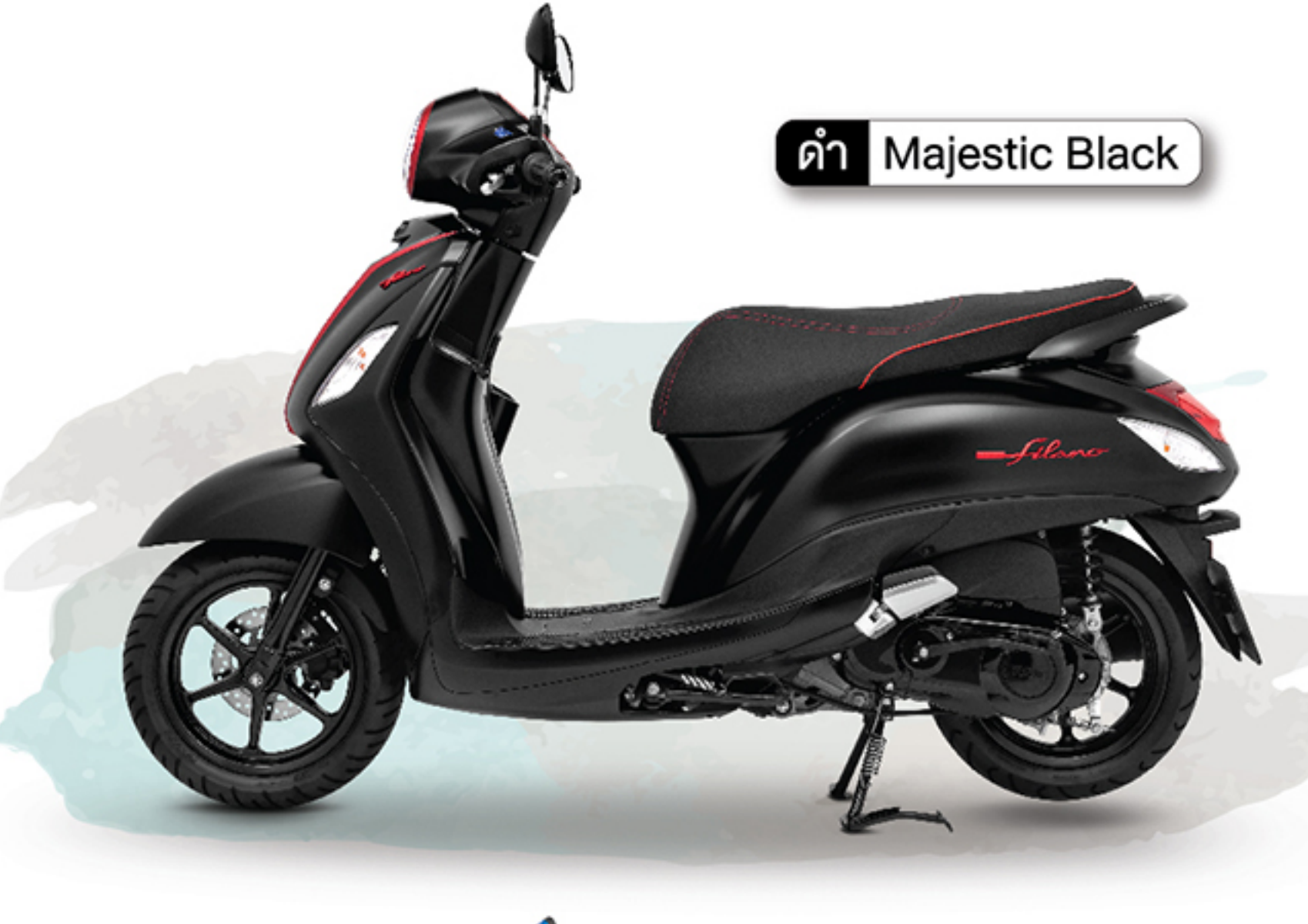
ดำ Majestic Black