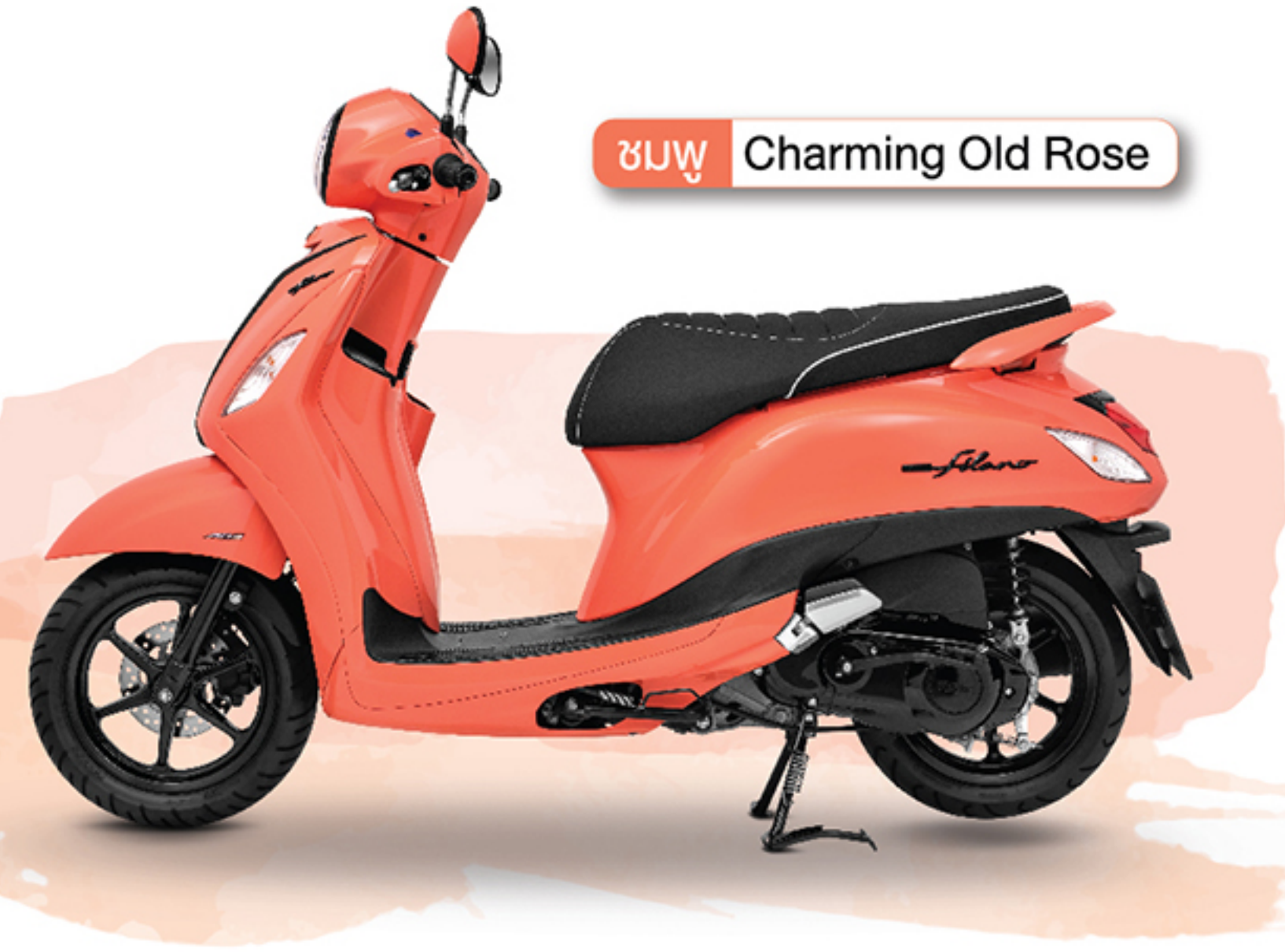
ชมพู Charming Old Rose